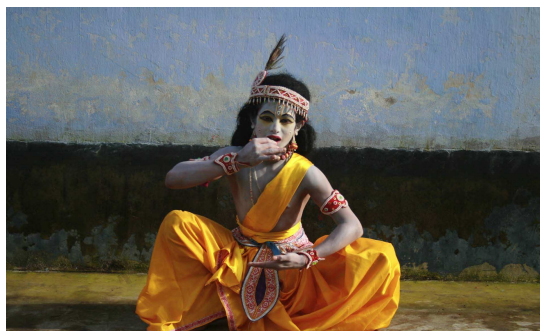
Cycle Inde, moines danseurs de Majuli

Du jeudi 10/06/10 au samedi 12/06/10 à 20h ; dimanche 13/06/10 à 17h