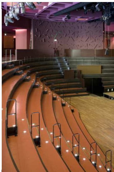
Théâtre Claude Lévi-Strauss

Situé au niveau jardin bas, le théâtre Claude Lévi-Strauss est une grande salle modulable, d'environ 500 places. Elle se présente comme un cirque dont le point le plus bas est le plateau scénique. C'est un espace de jeu et de parole permettant de remettre en question, pour certains événements, le rapport scène/salle frontale à l'occidentale.