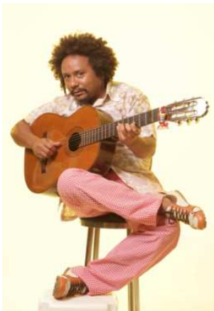
Chico César

Ce chanteur, auteur et compositeur rendu célèbre par son tube planétaire « Mama Africa » est un mélodiste de génie attaché aux rythmes traditionnels et modernes du Brésil, et plus largement du monde entier, qu'il incorpore avec bonheur et inventivité.