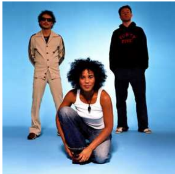
Zuco 103

Zuco 103 est une mixture étonnante entre une chanteuse brésilienne charismatique, un sampleur-batteur néerlandais et un clavier allemand. A ce talentueux trio de base s'adjoignent un guitariste, un percussionniste et un bassiste. Réunis, ils forment un ensemble novateur et chaleureux à l'enthousiasme communicatif. Les origines très diverses des membres traduisent bien l'état d'esprit qui règne dans ce combo hollandais, allemand et brésilien : une recherche permanente de rythmes savoureux, colorés, funky, inspirés par la bossa nova et la samba. Un chaleureux mix de samples, de sons électro, de percussions qui se mêlent à la voix et aux instruments traditionnels dans l'ambiance du carnaval et des bailes funk.