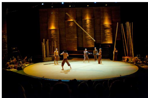
Lang Toi (« Mon Village »), nouveau cirque vietnamien

Institution culturelle et scientifique d'un type nouveau, à la fois musée, centre culturel, lieu de recherche et d'enseignement, le musée du quai Branly proclame le refus d'une quelconque hiérarchie des arts, comme d'une quelconque hiérarchie des peuples.