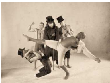
Incorporation(s) © Compagnie d'1 Autre Monde

Samedi 27/02/10 à 12h. Tous publics, adultes et enfants accompagnés. Foyer du théâtre Claude Lévi-Strauss.