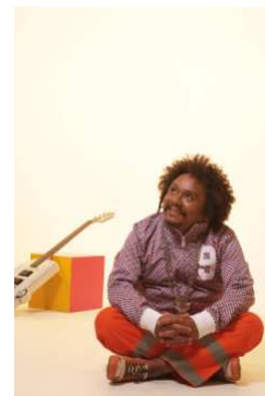
Chico César

A travers différents musiciens de forró et la participation de l'accordéoniste français Richard Galliano, ce film présente la musique du Nordeste brésilien, explorant son histoire, sa pratique et sa place dans la culture locale.