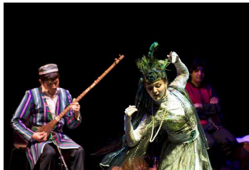
La route de la soie. Un voyage musical et poétique de la Perse à l'Asie centrale

Il célèbre l'universalité du génie humain à travers la grande diversité de ses créations culturelles. Élément essentiel du dispositif muséographique, la programmation valorise différentes formes d'expressions traditionnelles et contemporaines. La saison arts vivants du théâtre Claude Lévi-Strauss est proposée par Alain Weber et aborde les grandes traditions et cultures de notre monde afin d'en percevoir les liens et les prolongations dans notre univers actuel.