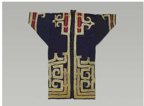
Manteau cérémoniel aïnou

L'immensité de l'Asie et sa profondeur historique ne permettent pas de traiter des expressions d'une incommensurable diversité dont les témoignages prestigieux des grands royaumes sont conservés dans d'autres musées. À cette unité introuvable répondent des objets d'apparence plus modestes et plus populaires, régulièrement recueillis dans des conditions particulières de missions « industrielles et scientifiques », des explorations géographiques et ethnographiques.