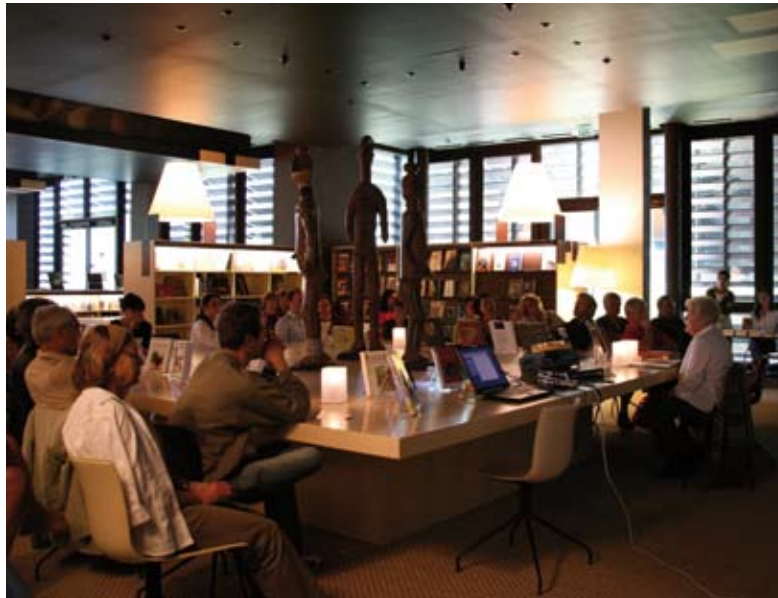
Salon Jacques Kerchache