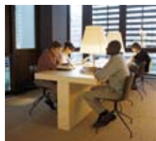
Le Salon de lecture Jacques Kerchache

Situé au rez-de-chaussée du musée, le salon de lecture est accessible à tous les visiteurs, aux horaires du musée.