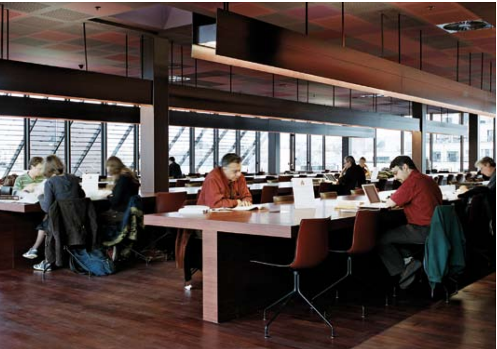
La médiathèque d'étude et de recherche

Les fonds documentaires s'enrichissent de textes sur l'art contemporain et la photographie non occidentale, ainsi que de récits de voyage et de livres rares et précieux, contribuant à éclairer les collections du musée.