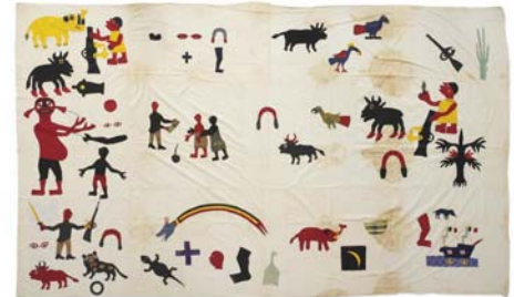
Tenture, République du Bénin, Abomey Coton et soie d'importation 19 e 20 siècle, 71.1930.54.99 musée du quai Branly, Paris

Figurées sur les bas-reliefs, les objets de pouvoir, mais aussi les textiles appliqués, les armoiries royales accompagnaient le roi tout au long de son règne. Objets symboliques et instrument de communication, les tentures réalisées par les artisans spécialisés, les yemadje , au service du palais, forment des sortes de tableaux commémoratifs où parfois plusieurs scènes peuvent être représentées. Ces grandes compositions servaient surtout dans le contexte religieux, funéraire ou associatif.