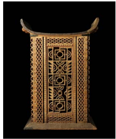
Trône du roi Béhanzin, Fon, République du Bénin, Abomey. Bois, pigments, Fin du 19 e siècle 71.1895.16.8. Don Général Dodds au musée d'ethnographie du Trocadéro, Paris musée du quai Branly

dans l'exposition évoque autant de tradition et d'autorité ; le modèle réduit (n°10), montre l'allure impressionnante qu'avait le roi Béhanzin dans son costume d'apparat avec sa longue pipe qu'il aimait fumer, sur l'un des trônes similaires à ceux qui sont exposés. Le roi devenait ainsi l'icône de la parole donnée, interprète des dieux et des ancêtres. De nombreuses photographies pour certaines inédites ou peu connues, réunies dans l'exposition, confirment le caractère sacré de l'image même de l'homme Béhanzin ; autoritaire et passionné de pouvoir.