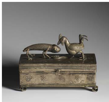
Boîte, Fon, République du Bénin, Abomey Argent, milieu du 19 e siècle Legs Antonetti, 1938, X362253 musée du quai Branly, Paris

Le prince Kondo prit le nom de Béhanzin, roi de la monarchie danxoméenne (ou dahoméenne), le 1 er janvier 1890, à la suite du décès de son père, le roi Glélé, le 29 décembre 1889, disparu dans un climat de crise inextricable avec les Français. Ceux-ci voulaient ouvrir le royaume de Dahomey en favorisant le port de Cotonou, porte économique des vastes territoires du Niger. Ils proposèrent en 1888 au roi Glélé, une « cessation de terre en toute propriété qui se paie 20 000 francs forfaitaires par an », (Ahanhanzo Glélé, 1974, p. 203) pour développer à Cotonou les transactions économiques. Cette somme dérisoire correspondait plutôt à une cession de droits de douane. Le prince Kondo qui recevait alors la délégation française, rejeta catégoriquement la négociation contraire aux traditions du royaume.