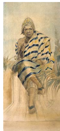
Portable de Béhanzin Esquisse sur toile 145 x 71 x 5,5 cm Collection Histoire, musée du quai Branly

Avant-dernier roi de la lignée des Agassouvi sur le plateau des Guédévi, Béhanzin est connu comme le roi ayant opposé une résistance farouche pendant presque deux ans à l'invasion coloniale de la terre de ses aïeux. Son armée était à différents titres très particulière puisque notamment composée en grande partie de femmes. Comme la plupart des rois, il a deux patronymes. Son premier nom est tiré de la phrase « Gbè hin azin bo aï djrè » : « L'univers tient l'œuf que la terre désire ». Le deuxième, « Le requin en colère vient troubler la barre », illustre sa volonté de défendre chaque pouce de la terre de ses aïeux contre les Français. La fin de son règne (1894) et son exil marquent la fin du royaume du Dahomey. Pendant les 12 ans de son exil, jamais Béhanzin n'a abandonné l'espoir de revenir dans son ancien royaume. Ses nombreuses lettres – dont certaines sont présentées dans l'exposition à la Fondation Zinsou - pour solliciter diverses personnalités afin d'intervenir en sa faveur l'attestent. Il meurt à Alger le 10 décembre 1906.