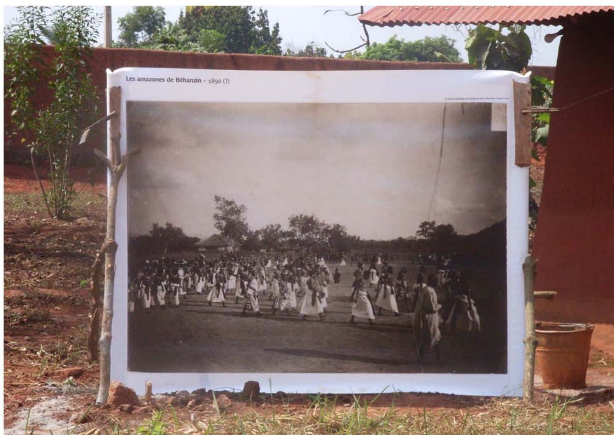
Installation des bâches au Musée historique d'Abomey

L'exposition, désormais permanente, se tient dans le palais de Béhanzin. Elle propose textes et artefacts allant des objets cérémoniels tels que les asens, les poteries, la statue zoomorphe, l'œuf tenu par deux mains, les tentures présentant les scènes de guerre, la mitrailleuse, le trône, le sabre, la pipe le chapeau du roi ainsi que de nombreux documents graphiques. Les 18 bâches offertes par le musée du quai Branly (1,65 mètres de hauteur et 0,95 jusqu'à 2,15 mètres de largeur), représentent Béhanzin à Abomey, pendant son exil en Martinique ainsi que les éléments marquants du conflit mis en image dans la presse d'époque.