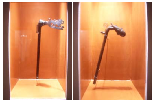
Salle des récades, Fondation Zinsou