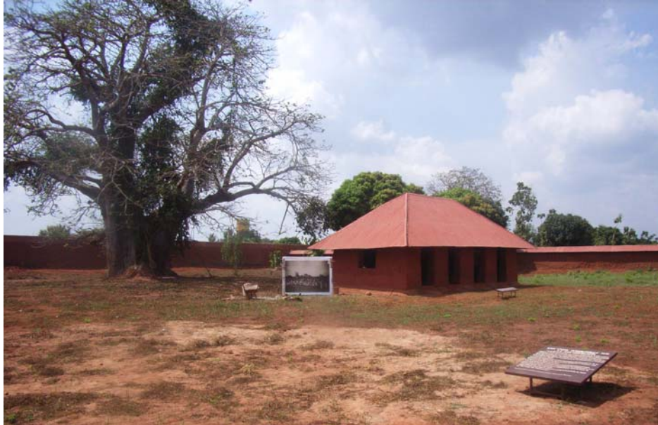
Musée historique d'Abomey

Depuis 1992, d'importants travaux de sauvegarde et de valorisation des bâtiments et des collections ont été réalisés. La Coopération italienne a été le donateur le plus généreux. Elle a financé, à travers ses fonds en dépôt à l'UNESCO, les opérations PREMA-Abomey pour un montant total de 450.000 USD. D'autres partenaires ont également contribué à ces travaux : le programme PREMA de l'ICCROM, l'UNESCO, le Centre du patrimoine mondial, le Getty Conservation Institute et la Suède.