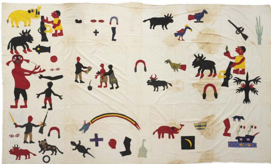
Tenture, République du Bénin, Abomey Coton et soie d'importation, 19 e -20 e siècle, 71.1930.54.99 musée du quai Branly, Paris

Le roi Glélé s'approprie aussi l'image de l'enclume et deux proverbes s'y rapportant : « On n'aiguise pas le couteau sur l'enclume pour ensuite frapper l'enclume avec lui » et « la nature a placé l'enclume dans la forge et elle s'est assise pour l'éternité ».