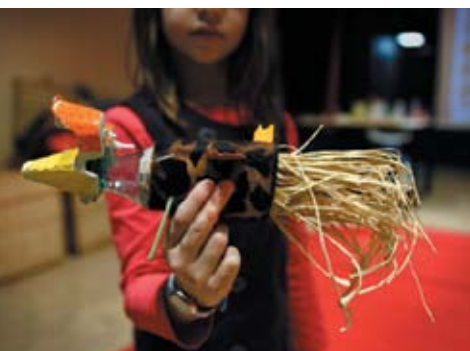
Atelier L'autre jouet, soutenu par Fnac éveil & jeux

Le musée participe à la transmission de savoirs, mais aussi de témoignages et d'émotions, en offrant aux visiteurs différentes formules qui engagent au dialogue des cultures. Les activités ont pour objectif une meilleure compréhension des cultures d'ailleurs. Contes, musiques, danses, arts plastiques, initiation à la démarche scientifique sont dévoilés aux adultes et aux enfants, seuls ou en famille.