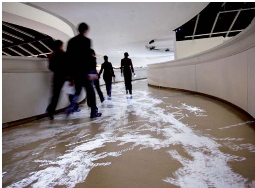
Installation multimedia «The River» par Charles Sandison, réalisée grâce au mécénat de Pernod Ricard

Photoquai, biennale d'envergure internationale dédiée à la photographie contemporaine, a pour but de révéler au public, tant amateur, collectionneur que professionnel, les nouveaux talents du monde. Chaque édition met un pays à l'honneur et présente une cinquantaine d'artistes du monde entier, à l'extérieur sur les quais de Seine, dans le Jardin et au sein des espaces d'exposition du musée. Photoquai est également présente dans de nombreuses institutions partenaires.