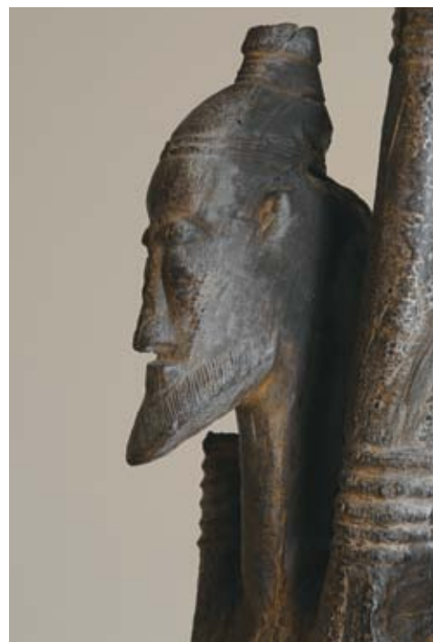
Statue Djennenke, ancienne collection d'Hélène et Pierre Leloup, acquise par l'État français grâce au mécénat d'AXA

Ces actions de solidarité à destination d'un public en marge des pratiques culturelles sont au centre du projet du musée et des valeurs qu'il défend : l'ouverture, le dialogue, le respect.