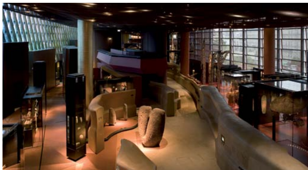
Vue du Plateau des collections et de la Rivière, parcours muséographique réalisé grâce au mécénat de Schneider Electric

Créée au printemps 2002, la société des Amis accompagne le développement et le rayonnement du musée en France et à l'étranger. Les Amis participent de façon privilégiée à la vie du musée : conférences, visites privées, invitations aux vernissages, propositions de voyages, etc. www.amisquaibranly.fr