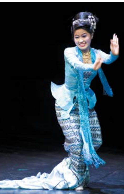
Le corps miroir du féminin : Cérémonie Nat-Pwe et danses de cours birmanes