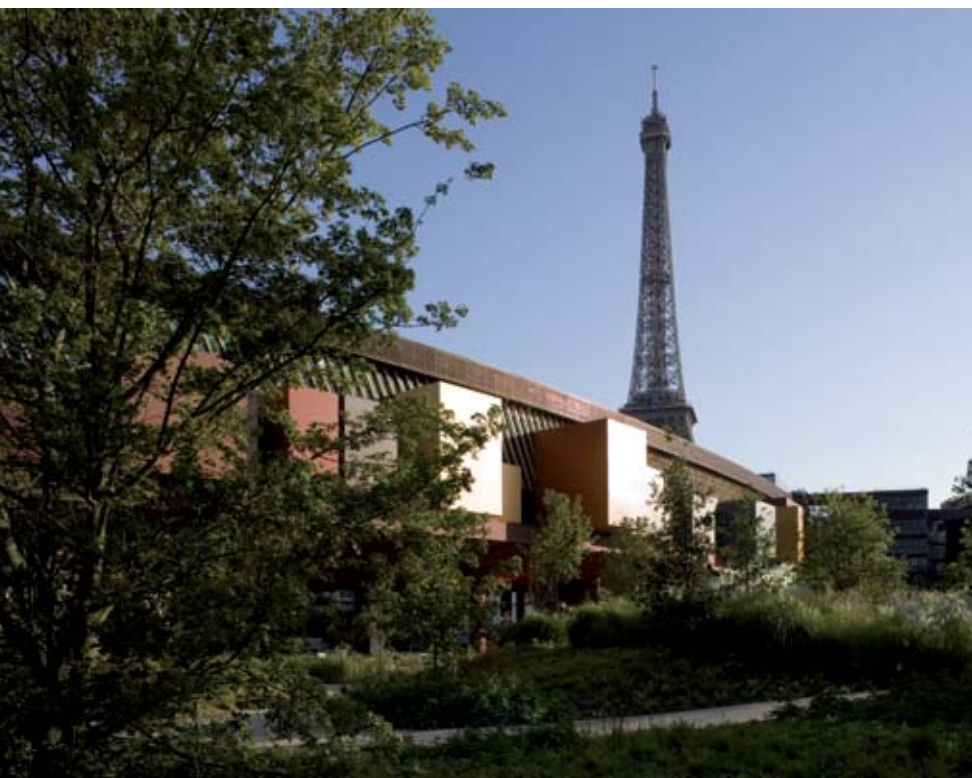
Jardin du musée, conçu par le paysagiste Gilles Clément et soutenu par la Fondation GDF SUEZ

Expositions, spectacles vivants, acquisitions et restaurations d'œuvres, réalisations dans le domaine de l'enseignement et de la recherche, projets pédagogiques, scientifiques, actions de coopération internationale, engagements pour l'accessibilité, le développement durable, la diversité culturelle, initiatives dans le champ social... Autant de domaines d'action auxquels les particuliers et les entreprises peuvent s'associer.