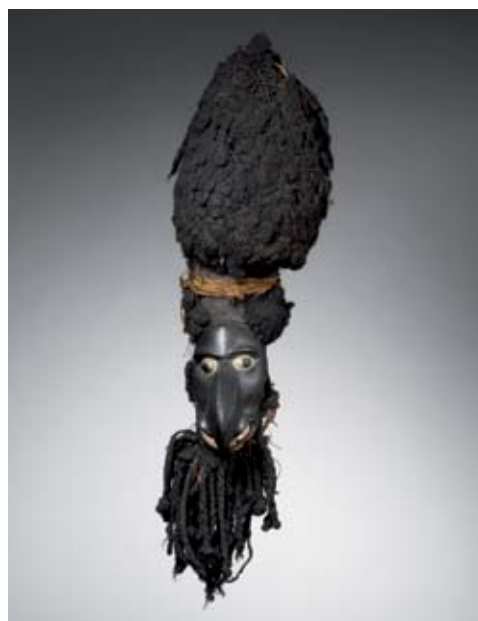
Masque kanak avant sa restauration réalisée grâce au mécénat de la Fondation BNP Paribas

L'ouverture du pavillon des Sessions au Louvre en 2000 et l'inauguration du musée du quai Branly, six ans plus tard, symbolisent des tournants majeurs dans l'histoire du regard que l'Occident porte sur les arts et civilisations d'Afrique, d'Asie, d'Océanie et des Amériques. Pour continuer à mettre en valeur la profondeur historique des cultures présentées, la diversité de signification des pièces et la qualité des choix muséographiques proposés, le musée se donne pour priorité de poursuivre une politique constante d'enrichissement de ses collections.