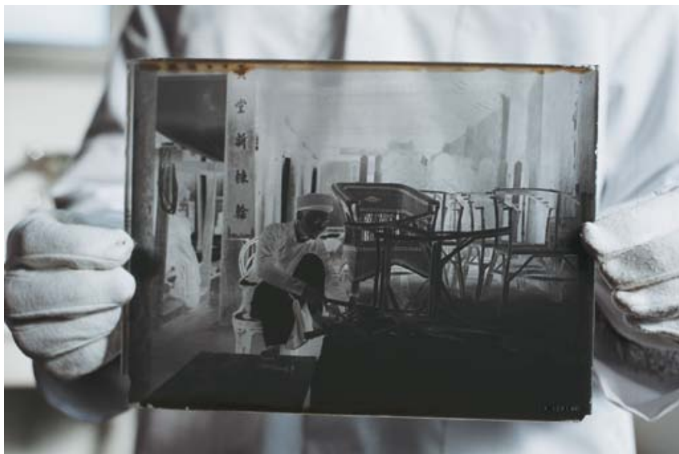
Le patrimoine photographique du musée du quai Branly

La bibliothèque virtuelle est un projet de numérisation des ensembles de textes fondateurs d'ethnologie. Il s'agit, dans une perspective internationale, de regrouper des textes de langue anglaise, allemande, française, ou autres, et de proposer leur accès gratuit sur le site Internet du musée.