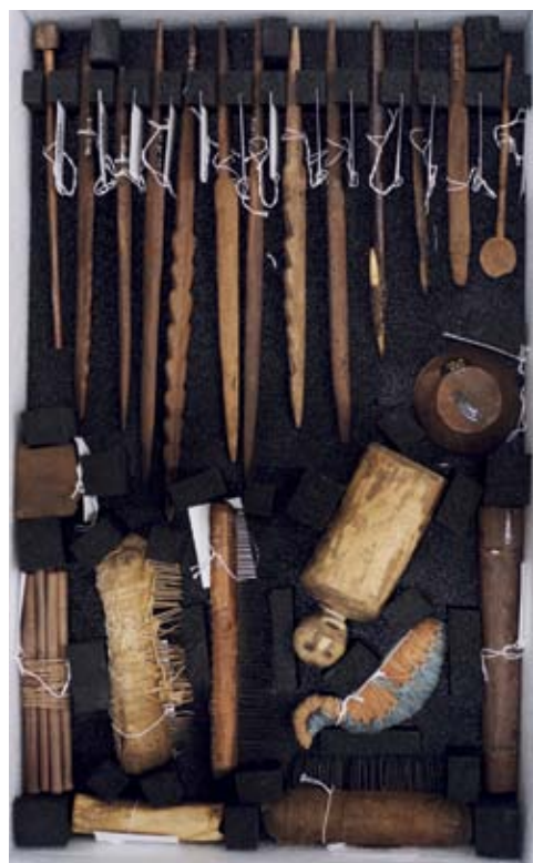
Réserves du musée

Le musée a choisi de développer une offre nouvelle et exceptionnelle : offrir au public un service de consultation des œuvres conservées en réserve dans des salles spécialement aménagées, qui renferment près de 300 000 œuvres.