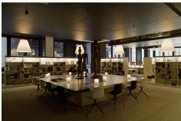
Salon de lecture Jacques Kerchache

Le musée rend hommage à l'un de ses principaux initiateurs en baptisant le salon de lecture de la médiathèque du nom de Jacques Kerchache, grand collectionneur français disparu en 2001.