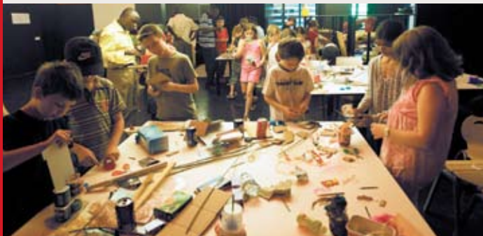
Atelier «L'Autre jouet»