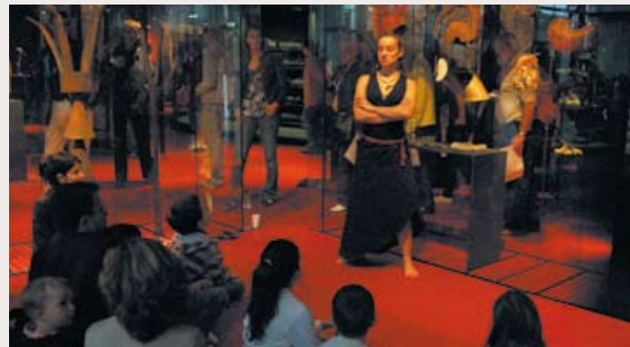
Visite contée pour les enfants

Profitez d'une visite libre des collections du musée en utilisant le parcours famille de l'audioguide. Un parcours ludique de découverte des œuvres à votre rythme (5 € pour la première personne, 2 € par personne supplémentaire).