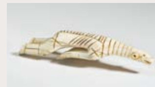
« Upside Down » Ivoire sculptée