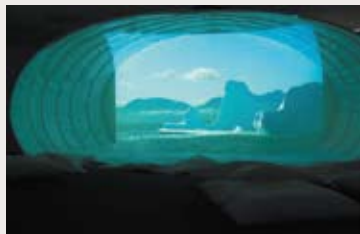
Installation Sila © Philippe Le Goff