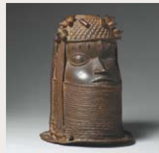
Tête anthropomorphe