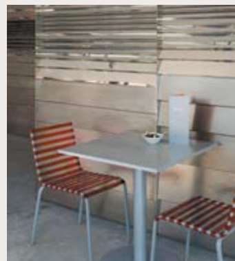
musée du quai Branly. Le café Branly.