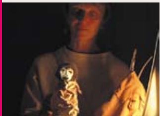
Ninioq © Compagnie Par les Villages