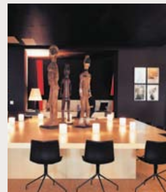
Le salon de lecture Jacques Kerchache.