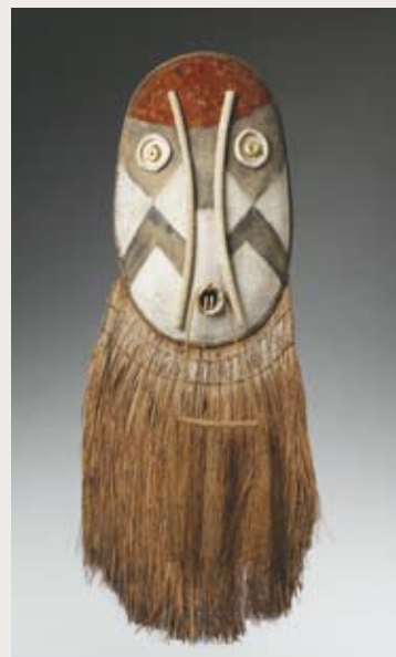
Objet en plumes

Objet magique : les enfants créent leur propre objet magique à partir de l'observation de ceux venus d'Afrique centrale.