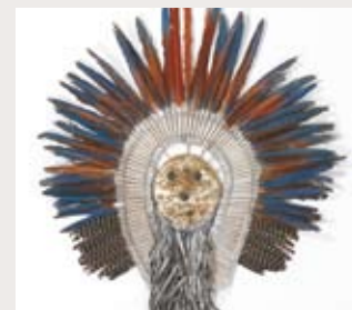
Objet en plumes