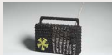
« Planète Métisse » Radio enveloppée

L'exposition présente de manière chronologique les relations entre le jazz et les arts graphiques à travers le XX e siècle.