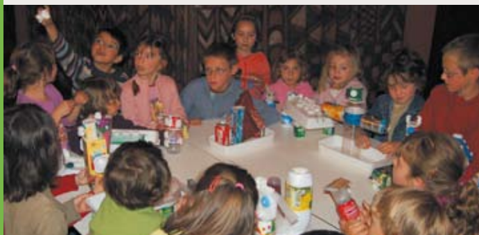
Atelier pour enfants : «L'Autre Jouet»