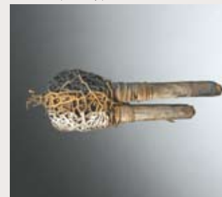
Objet magique