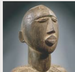
Statue féminine