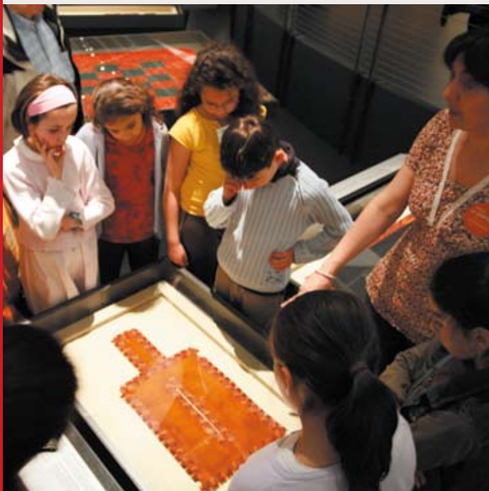
Atelier « Enigme de la momie péruvienne »

L'énigme de la momie : le temps d'une fouille fictive, les apprentis archéologues découvrent une momie du Pérou.