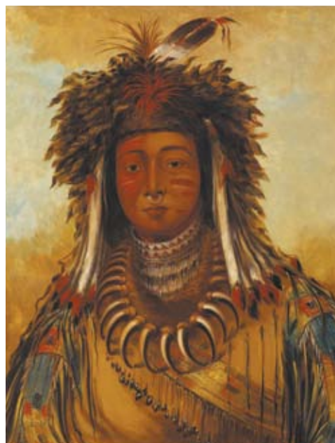
Portrait de chef indien