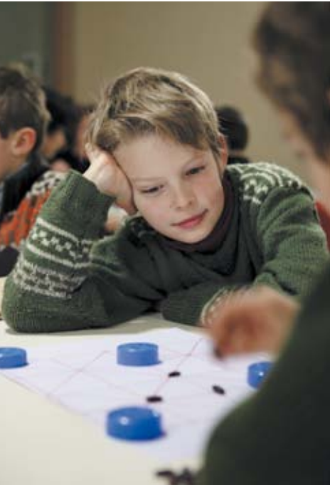
L'autre jouet : jeux d'Himalaya