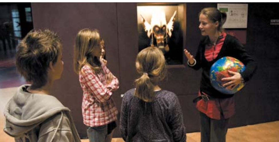
Le secret du masque

Dans l'exposition Les Maîtres du désordre