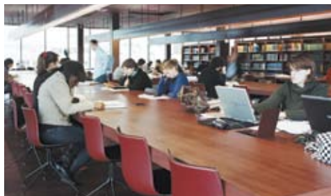
La médiathèque d'étude et de recherche

La recherche sur les catalogues en ligne ( www.quaibrantly.fr , rubrique Documentation scientifique) permet de préparer une consultation dans les quatre espaces de la médiathèque : la médiathèque d'étude et de recherche, le cabinet des fonds précieux, la salle de documentation et des archives et le salon de lecture Jacques Kerchache.