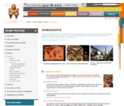
Site web www.quaibrantly.fr , rubrique Enseignants