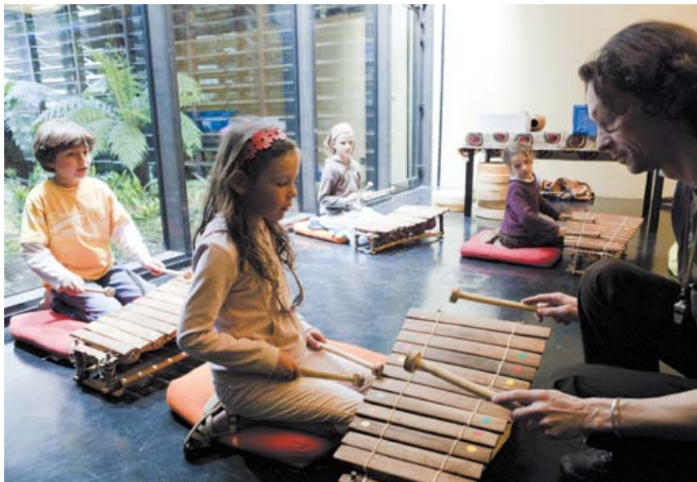
Destination : Musiques

À la rencontre des cultures par le chemin des sons ! Vos élèves écoutent, observent et jouent des instruments d'Afrique, d'Asie, d'Amérique ou d'Océanie, découvrent les musiques qui rythment la vie des hommes.