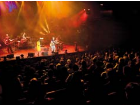
Spectacles. Zuco 103