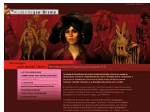
e-mallette « Des images pour penser l'Autre » © musée du quai Branly Adresse : http://modules.quaibrantly.fr/e-mallette/