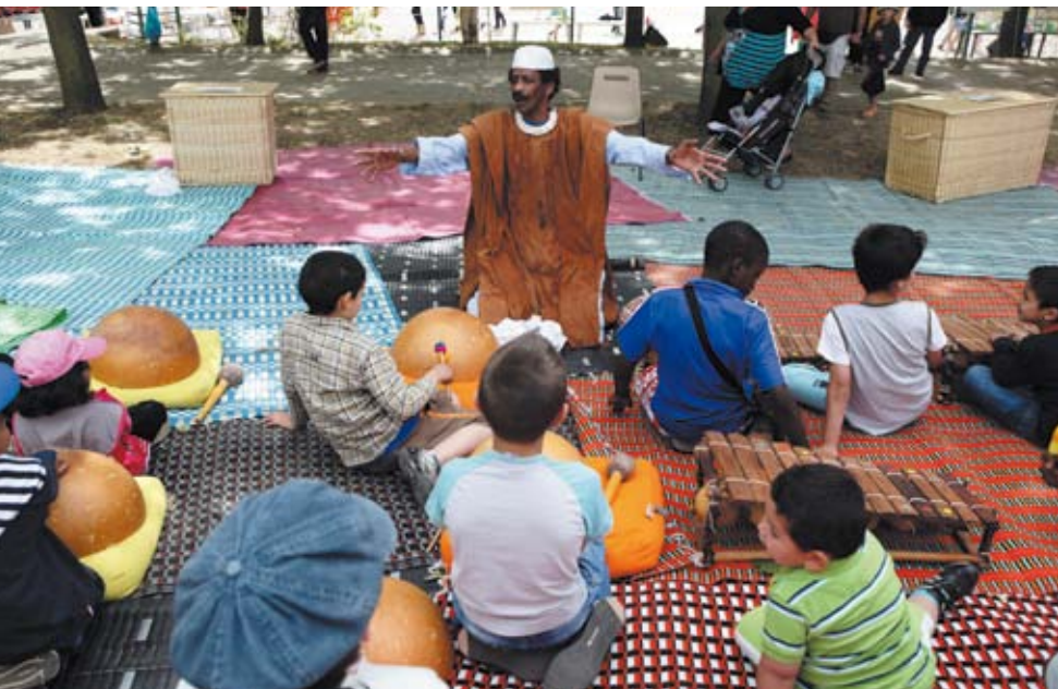
Montreuil. Hors les murs. Café Maquis. Destination musique du Mali

Retrouvez l'appel à projet dès mai 2011 sur www.quaibrantly.fr rubrique « enseignants » et sur le site de la Délégation Académique à l'éducation Artistique et Culturelle du Rectorat de Créteil.