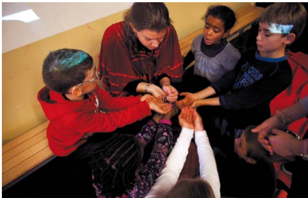
L'autre jouet : jeux d'Himalaya

Vos élèves constituent des équipes d'ethnologues. Un objet mystérieux est sorti des réserves du musée : sauront-ils l'identifier et lui attribuer une place dans les vitrines du musée ?