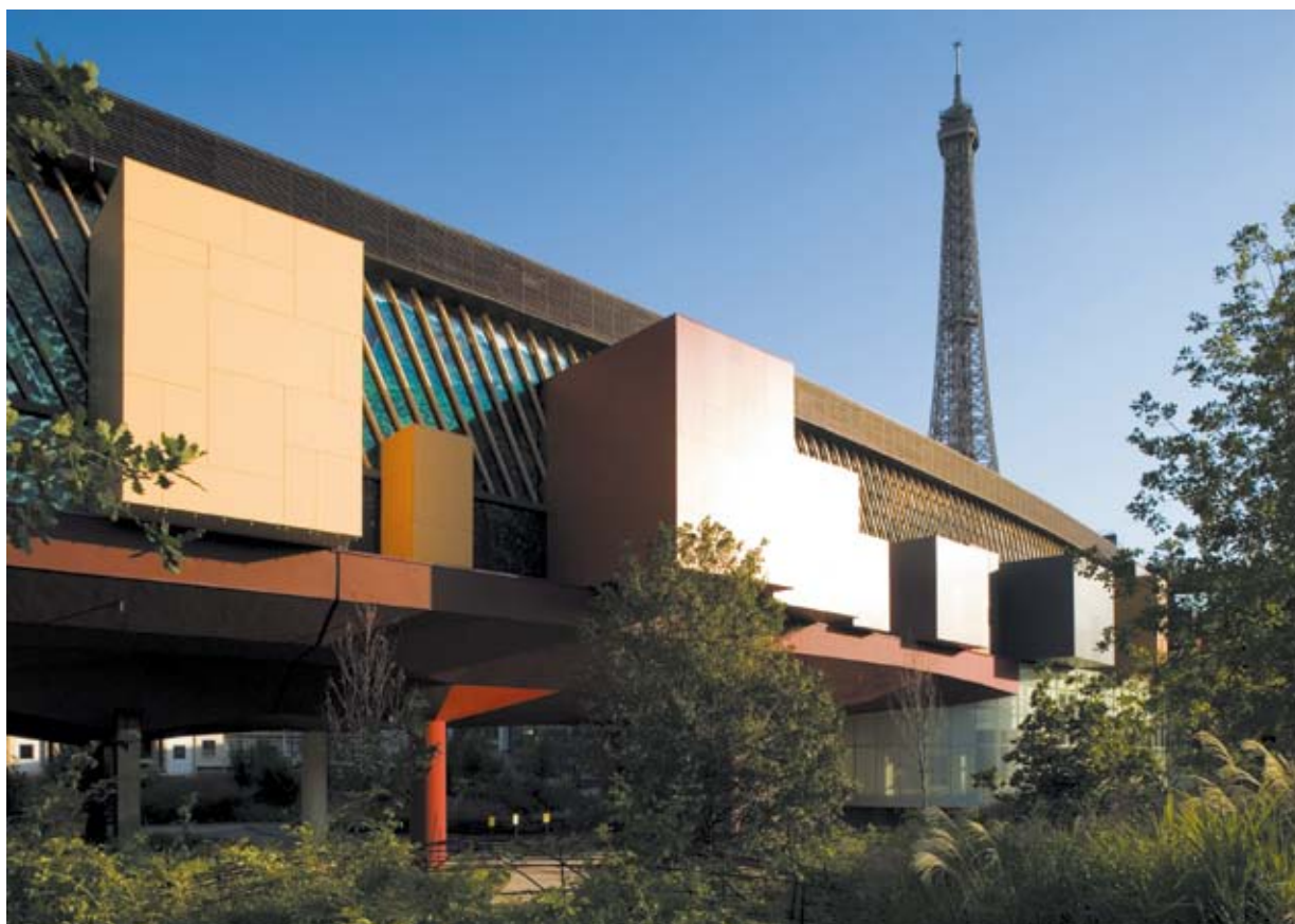
Le jardin du musée conçu par le paysagiste Gilles Clément a été réalisé grâce au mécénat de la Fondation GDF SUEZ

Hommage permanent aux arts et civilisations d'Afrique, d'Asie, d'Océanie et des Amériques, le musée du quai Branly, pour sa 6 e saison, élargit l'éventail de ses activités : en plus des visites guidées, contées et ateliers dont vous assurez le succès d'année en année, cette cité où dialoguent les cultures propose cette année de nouvelles actions en écho aux expositions temporaires et à ses collections de référence. Conférences à deux voix, concerts contés, concours scolaires ou parcours en partenariat procurent aux enfants et aux adolescents, de la maternelle au lycée, une ouverture aux œuvres et aux autres, enrichissant leur vision du monde et leur goût des savoirs.