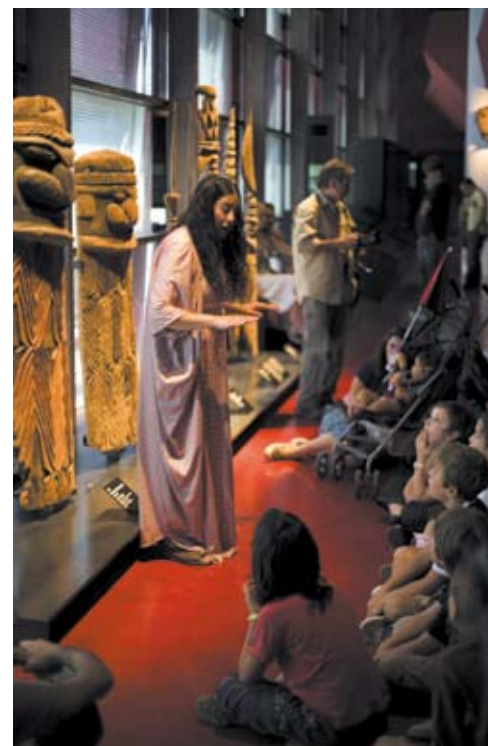
Visite contée Océanie