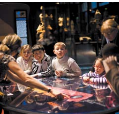
Projet Cinquième Jour Globe Trotter en faveur des personnes handicapées