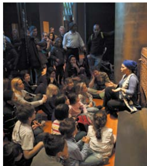
Visite contée Maghreb. La magie du désert

Contes, comptines et petits jeux : un voyage en histoires et en chansons pour un éveil des tout petits aux sonorités d'Afrique, d'Asie, d'Océanie et des Amériques.