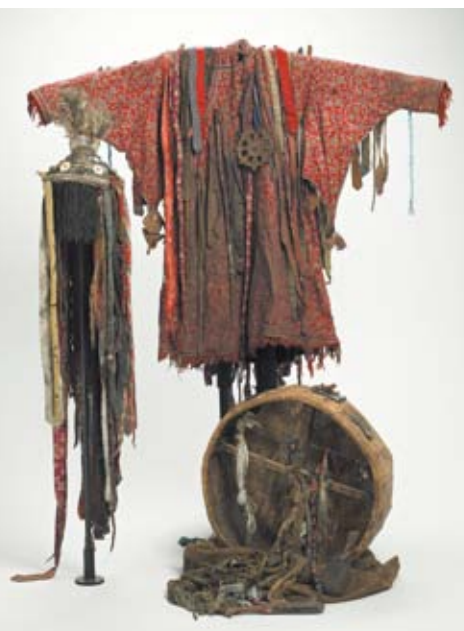
Costume complet de chamane : manteau