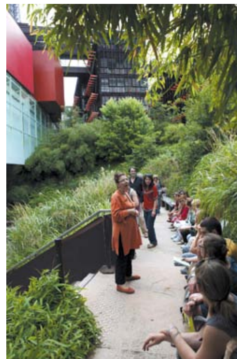
Jardin d'artiste

Vos élèves constituent des équipes d'ethnologues. Un objet mystérieux est sorti des réserves du musée : sauront-ils l'identifier et lui attribuer une place dans les vitrines du musée ?