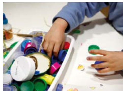
Atelier : L'autre jouet