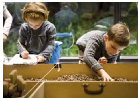
Atelier : Mission archéo Mexique