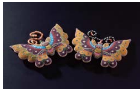
Décoration de lit nuptial en forme de papillon