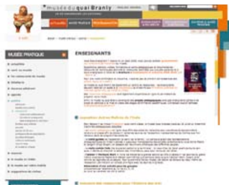
Site web www.quaibrantly.fr , rubrique Enseignants