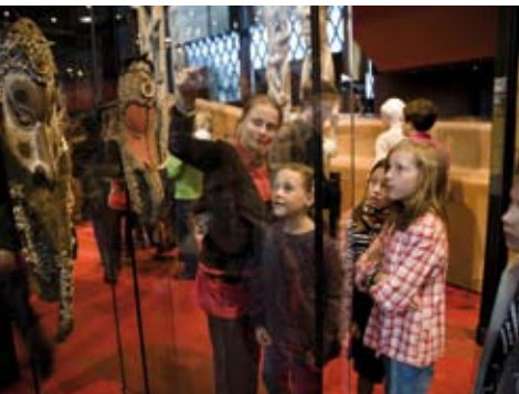
Visite: Le secret du masque

Vos élèves constituent des équipes d'ethnologues. Un objet mystérieux est sorti des réserves du musée : sauront-ils l'identifier et lui attribuer une place dans les vitrines du musée ?