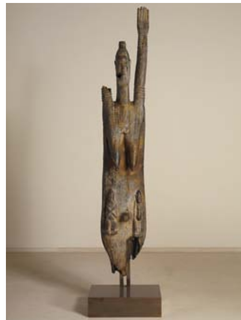
Statue Djeneké, anc. Coll. H. et P. Leloup, acquise par l'État français grâce au mécénat du groupe AXA

L'exposition a été réalisée en partenariat avec le musée du Louvre.