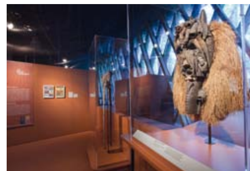
Exposition d'anthropologie La Fabrique des images