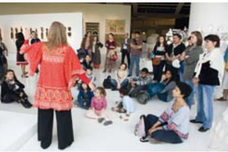
Visite contée Inde