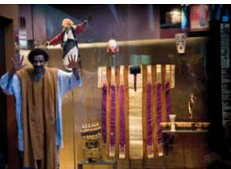
Visite contée avec des enfants à mobilité réduite

Contes, comptines et petits jeux : un voyage en histoires et en chansons pour un éveil des tout-petits aux sonorités d'Afrique, d'Asie, d'Océanie et des Amériques.