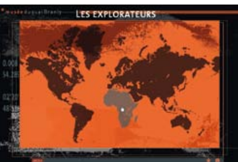
Dossier pédagogique « Les Explorateurs »