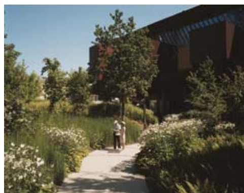
Vue sur le jardin. Scénographie réalisée par le jardinier, paysagiste et botaniste Gilles Clément

Protégée par une palissade de verre, la végétation façonnée par Gilles Clément accueille les visiteurs dans ses sentiers, clairières et bassins.