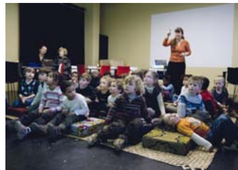
Atelier : L'objet magique

Vos élèves constituent des équipes d'ethnologues. Un objet mystérieux est sorti des réserves du musée : sauront-ils l'identifier et lui attribuer une place dans les vitrines du musée ?