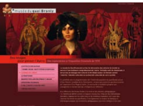
e-mallette « Des images pour penser l'Autre »